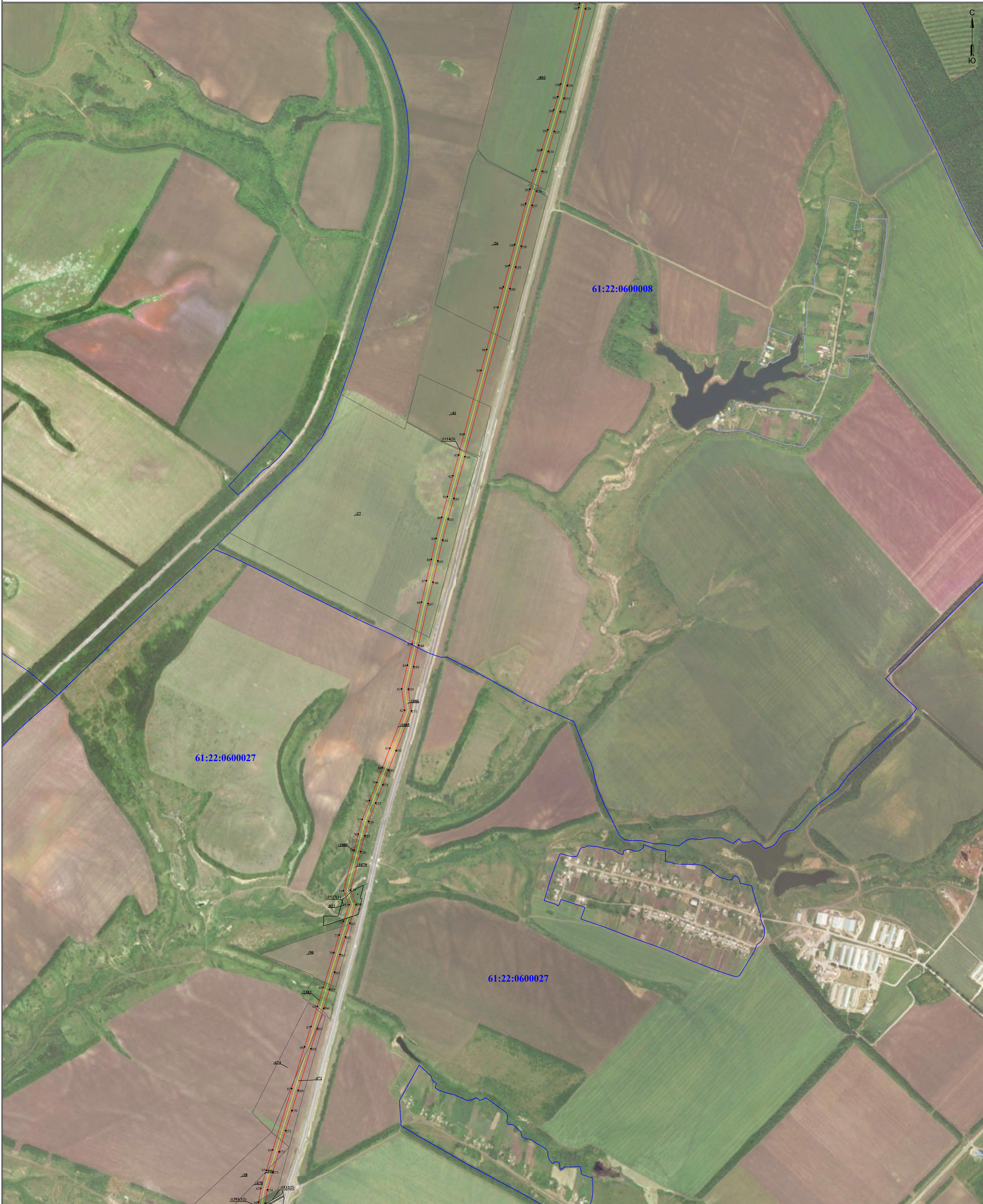
Схема расположения границ публичного сервитута для размещения объекта ВЛ 35 кВ «ГСК-Мальчевская» (наименование объекта)