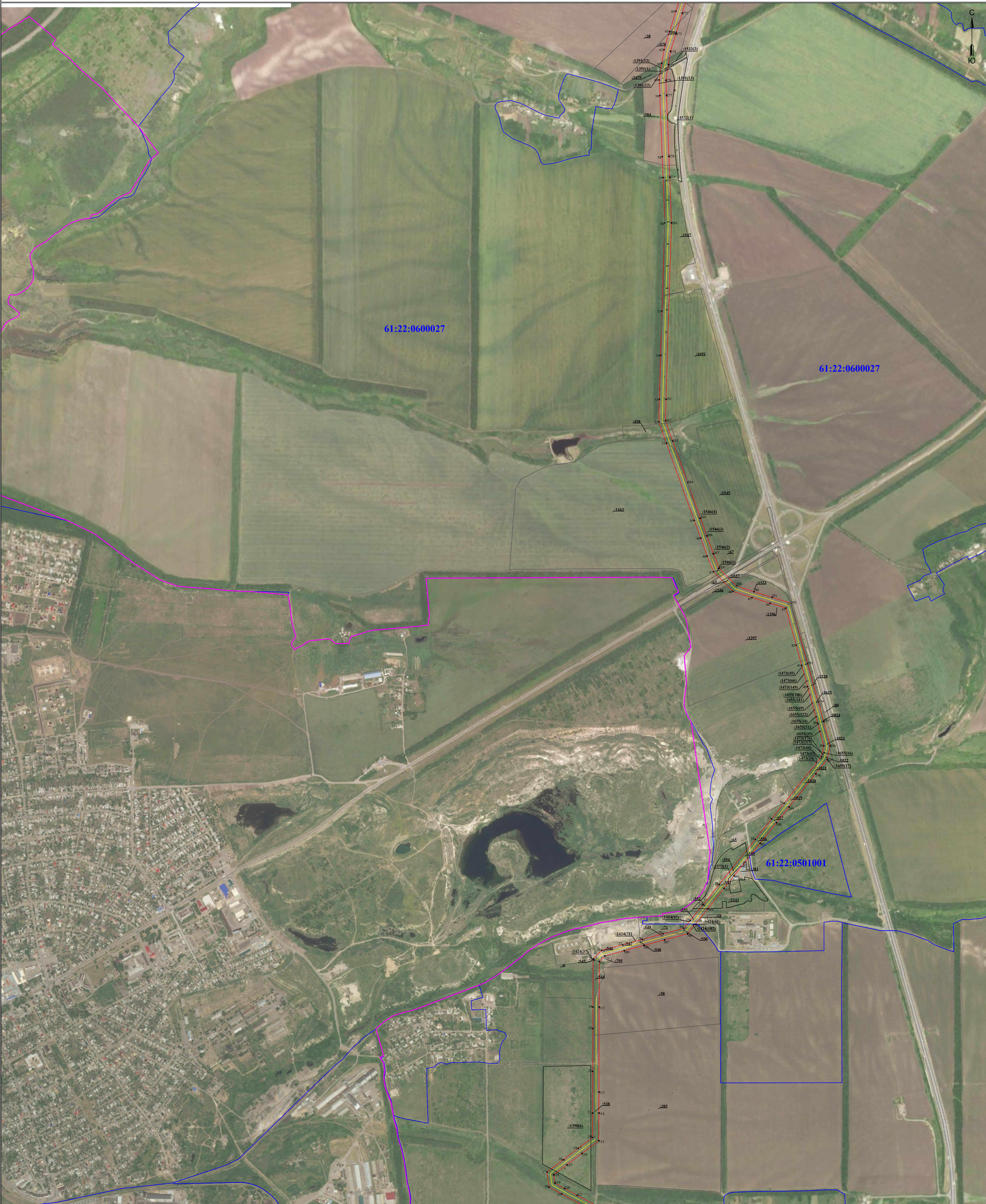
Схема расположения границ публичного сервитута для размещения объекта ВЛ 35 кВ «ГОК-Мальчевская» (наименование объекта)